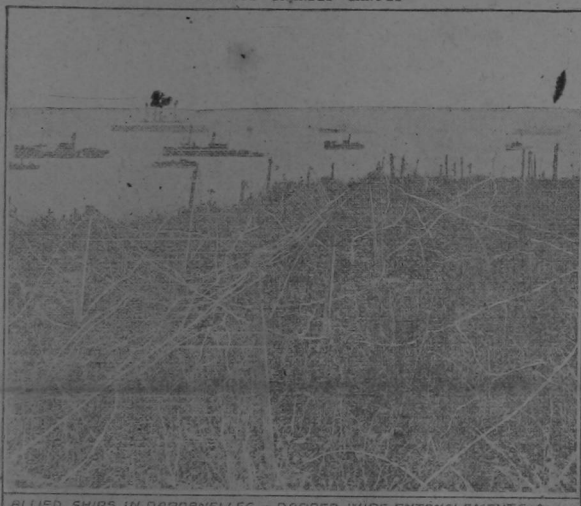
ALLIED SHIPS IN DARDANELLES - BARBED WIRE ENTANGLEMENTS

Uno de los barcos austriacos que tomó parte en el combate naval con barcos italianos y que se libró entre Trieste y Venecia fue el "Veribus Unitis". Esta grabado muestra una fotografía de este buque.